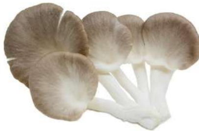
รูปภาพที่ ๑ ดอกเห็ดนางฟ้าภูฐาน

ที่มา ศูนย์ส่งเสริมและพัฒนาอาชีพการเกษตร จังหวัดระยอง