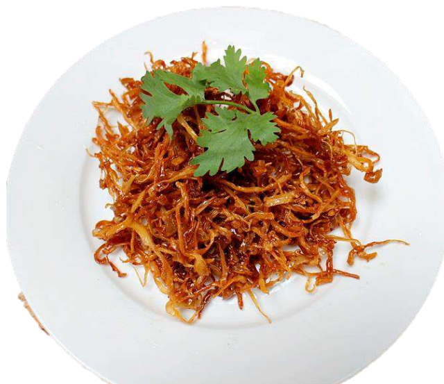
รูปที่ ๔ เห็ดนางฟ้าสามรส

ที่มา https://www.pim.in.th/vegetarian-side-dish/743-shredded-mushroom