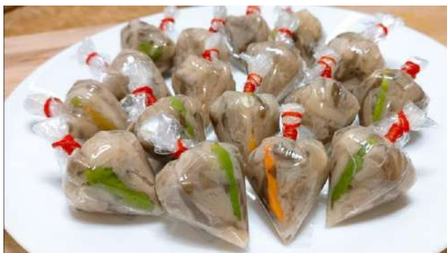
รูปที่ ๓ แหมมเห็ด

ที่มา https://krua.co/cooking_post/sourmushroom