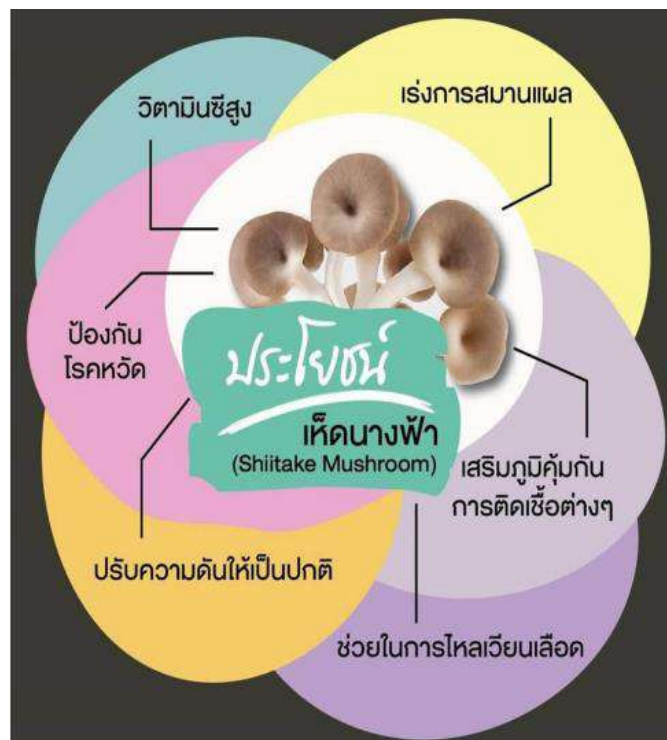
รูปที่ ๒ ประโยชน์ของเห็ดนางฟ้า