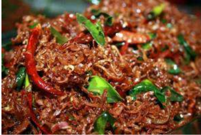
รูปที่ ๕ น้ำพริกเห็ดกรอบ

๙. รสชาติอาจปรับเปลี่ยนตามความชอบส่วนตัวได้นะคะ แล้วนำไปใส่ภาดพักไว้จนเย็น ใส่เม็ดมะม่วง รอย ใบมะกรูดทอดลงไป เสร็จเรียบร้อย