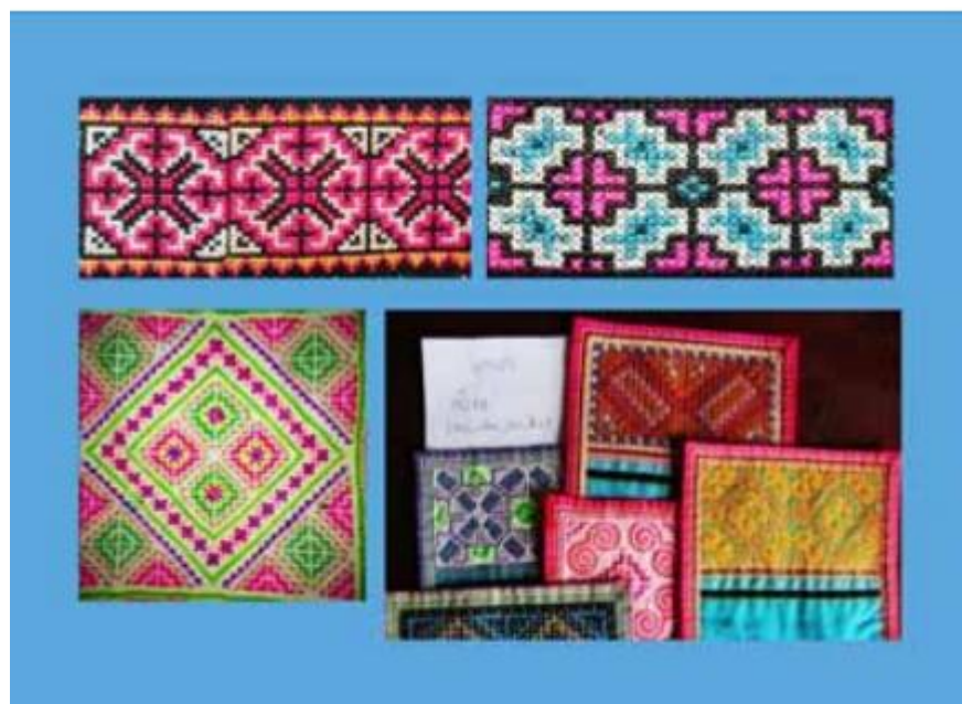
ภาพตัวอย่างลายผ้าปักม้งโบราณ ที่มีที่มาจากธรรมชาติและอักษรม้งโบราณ