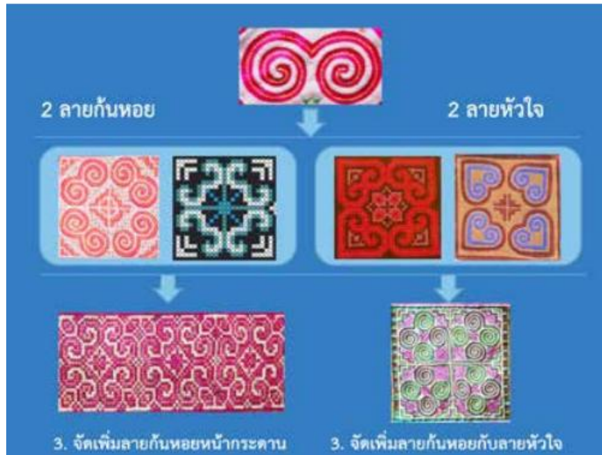
ภาพวิเคราะห์ลายผ้าปักม้ง