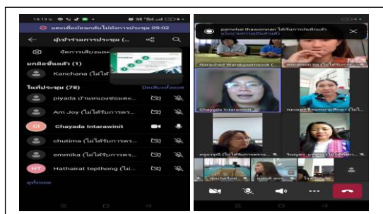
อบรมการเขียน แผนธุรกิจออนไลน์

๓. ดำเนินการเขียนแผนธุรกิจในการพัฒนาผลิตภัณฑ์กิจกรรมศาสตร์พระราชา พัฒนาผลิตภัณฑ์ จากใบไม้สู่ ใยผ้า