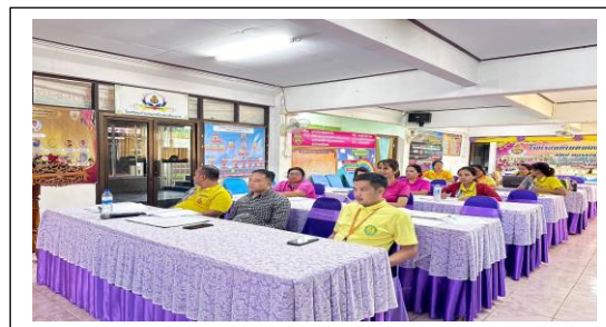
การประชุมคณะกรรมการขับเคลื่อนหลักสูตรท้องถิ่นสู่กิจกรรมการจัดการเรียนรู้

๒. เข้าร่วมการจัดการอบรมการเขียน แผนธุรกิจออนไลน์ โรงเรียนเครือข่าย โครงการนักรุกกิจน้อย มีคุณธรรม นำสู่เศรษฐกิจสร้างสรรค์