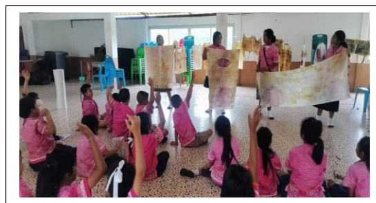
การประชุมคณะกรรมการนักเรียนกลุ่มแกนนำนักรุกกิจน้อยมีคุณธรรมนำสู่เศรษฐกิจ