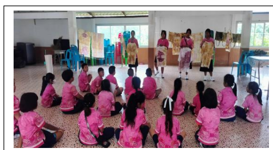
การอบรมศิลปะจากใบไม้สู่ลายผ้า