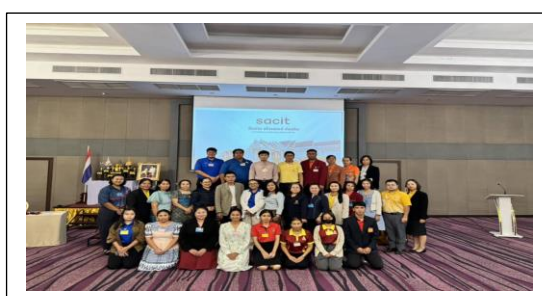
การอบรมเชิงปฏิบัติการการสร้างนวัตกรรมผู้ประกอบการโรงเรียนเครือข่าย