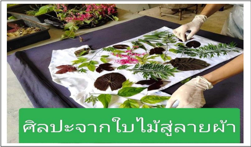
ภาพขั้นตอนการทำ ศิลปะจากใบไม้สู่ลายผ้า Sela