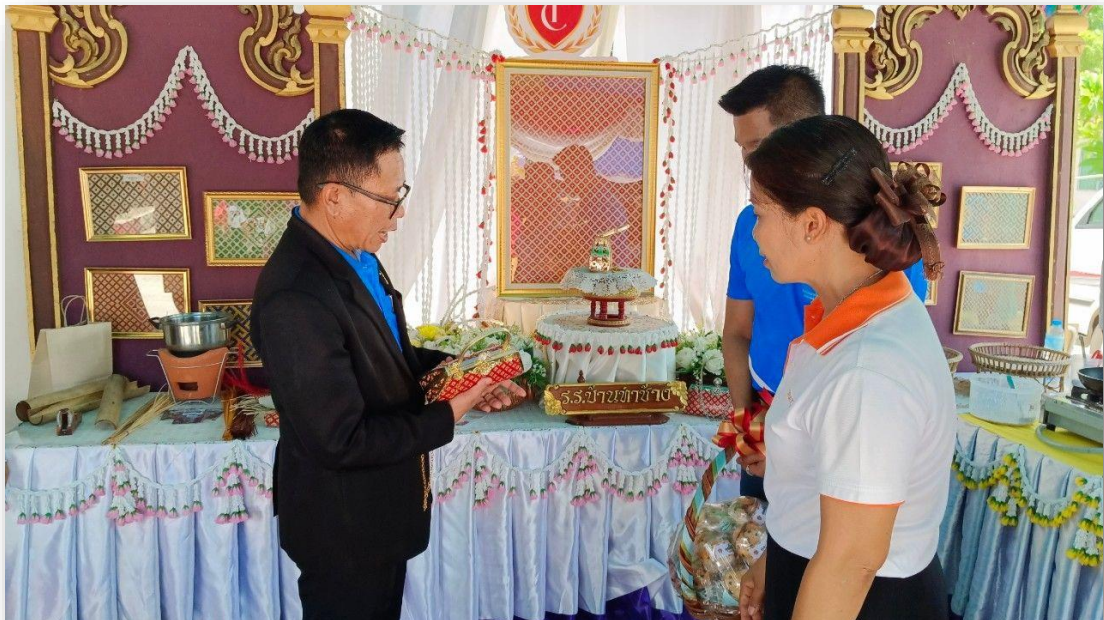
นักเรียนนำผลงานไปจัดแสดงในกิจกรรมต่างๆ