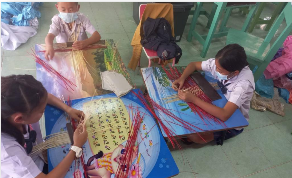
นักเรียนทำการเรียนรู้ในกิจกรรมงานสาน