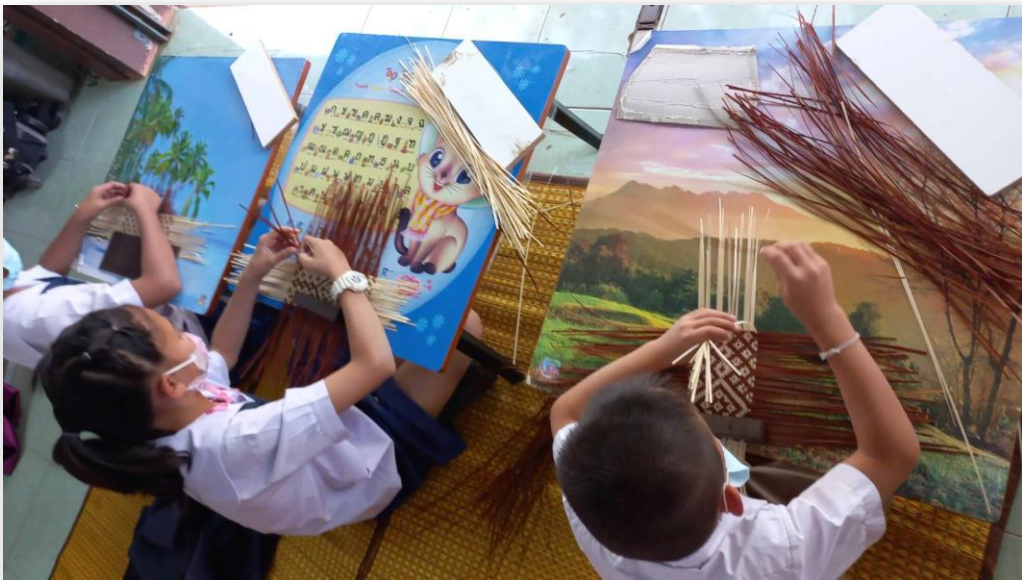
นักเรียนทำการเรียนรู้ในกิจกรรมงานสาน