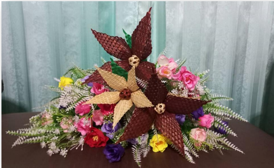
นักเรียนจัดนำผลงานในรูปแบบต่างๆ