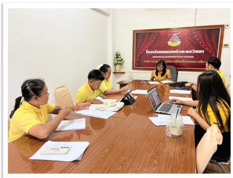
รูปที่ ๑ การประชุมคณะกรรมการขับเคลื่อนหลักสูตรท้องถิ่นสู่กิจกรรมการจัดการเรียนรู้

๑. โรงเรียนจัดทำหลักสูตรท้องถิ่นพร้อมทั้งบูรณาการโดยการน้อมนำหลักปรัชญาของเศรษฐกิจพอเพียง ซึ่งเป็นแนวทางในการดำเนินชีวิตและการประพฤติปฏิบัติตน มาใช้ในกระบวนการดำเนินงาน