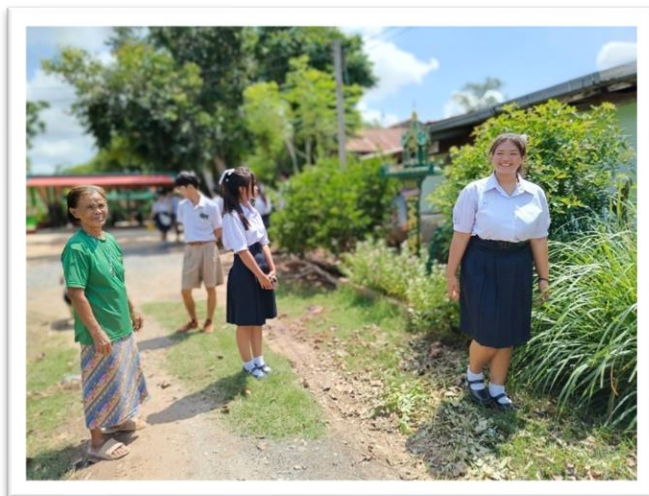
รูปที่ ๗ กิจกรรมพัฒนาสวนสมุนไพรพริกแกงในโรงเรียน และครัวเรือนนักเรียน