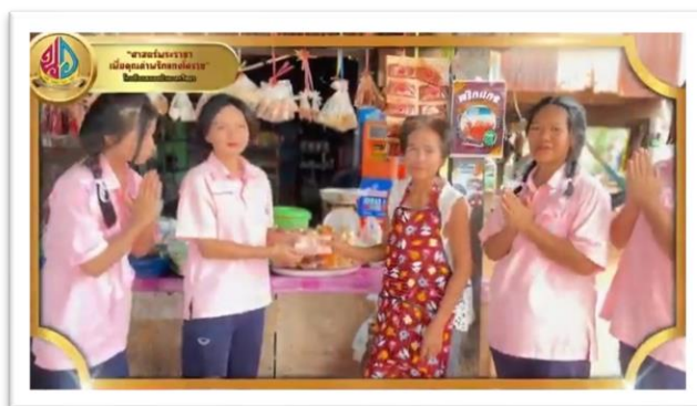
รูปที่ ๘ การจัดจำหน่ายผลิตภัณฑ์ร้านค้าในชุมชน