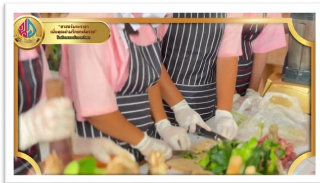
รูปที่ ๙ กิจกรรมการผลิตพริกแกงโคราช