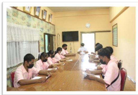
รูปที่ ๒ ประชุมชี้แจง ประชาสัมพันธ์นักเรียนและคณะครูเพื่อปฏิบัติกิจกรรม

นักเรียนการลงพื้นที่ศึกษาแหล่งเรียนรู้พริกแกงโคราชที่มีในชุมชน