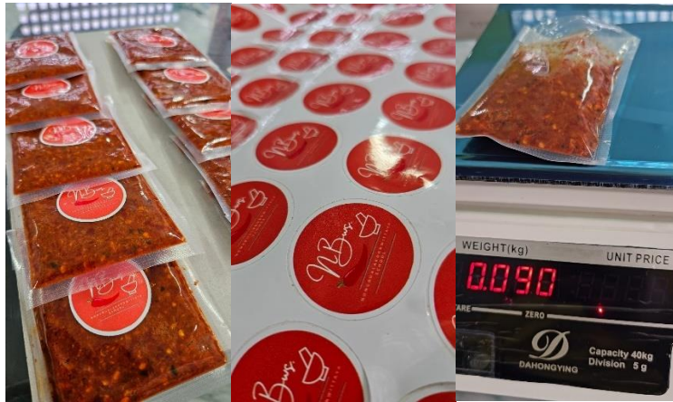
รูปที่ ๑๐ ออกแบบและพัฒนาผลิตภัณฑ์จากพริกแกง