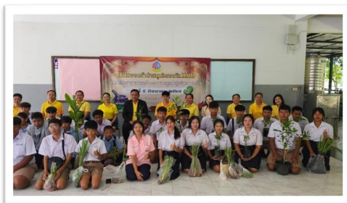
รูปที่ ๒ กิจกรรมทอดผ้าป่าสมุนไพรรองเรียน

๒. จัดกิจกรรมกิจกรรมศาสตร์พระราชาสวนครัวพริกแกงพร้อมทั้งเข้าร่วมการจัดการอบรมการเขียนแผนธุรกิจออนไลน์ โรงเรียนเครือข่าย โครงการนักรุกกิจน้อย มีคุณธรรมนำสู่เศรษฐกิจสร้างสรรค์