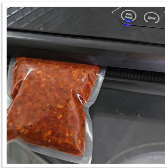
รูปที่ ๗ การพัฒนาผลิตภัณฑ์จากพริกแกงโคราช