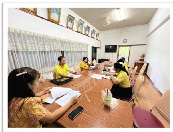
รูปที่ ๑ การดำเนินงานประชุมคณะกรรมการหลักสูตรสถานศึกษาเพื่อวางแผนการดำเนินงาน