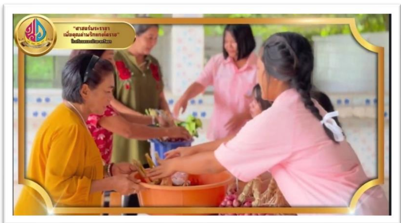
รูปที่ ๑๔-๑๕ การขยายผลสูตรพริกแกงโคราชของโรงเรียนหนองบัวละครวิทยาสู่ผู้ประกอบการในชุมชน