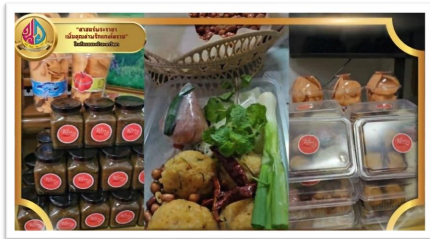
รูปที่ ๑๑ กิจกรรมการแปรรูปผลิตภัณฑ์จากพริกแกงโคราช