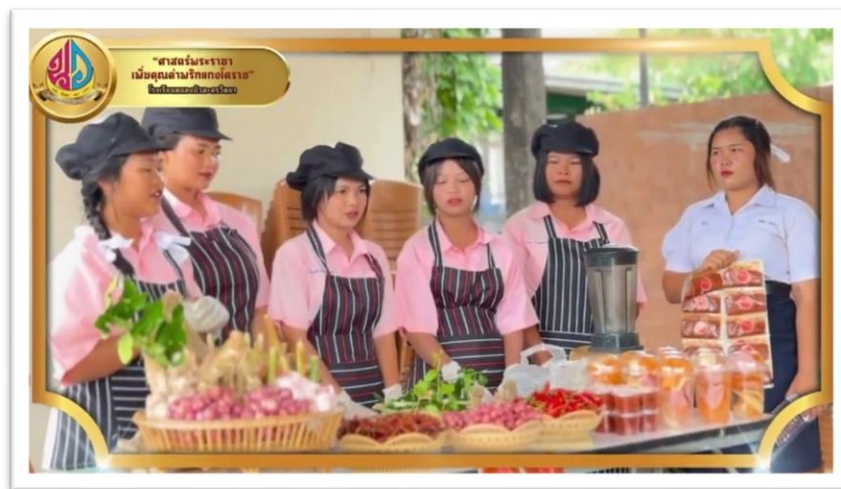
รูปที่ ๑๒ กิจกรรมการแปรรูปผลิตภัณฑ์จากพริกแกงโคราช