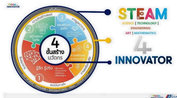
รูปที่ ๒.๑ แสดง STEAM & INNOVATOR

ขั้นตอนของ STEAM & INNOVATOR กระบวนการ ๔ ขั้นตอนในการสร้างสรรค์นวัตกรรมแบบ STEAM&INNOVATOR ที่เป้าหมายดีพูดถึง สามารถนำไปปรับใช้ได้ มีดังนี้