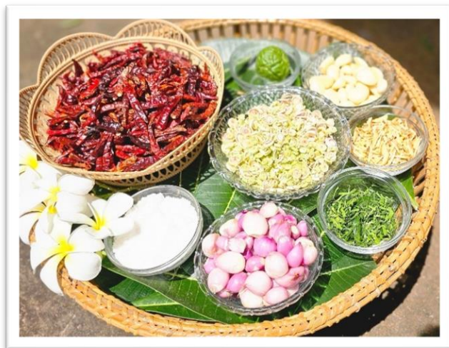
รูปที่ ๘ วัตถุดิบพริกแกงโคราช