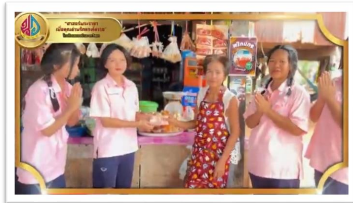
รูปที่ ๑๓ การจัดจำหน่ายผลิตภัณฑ์จากพริกแกง